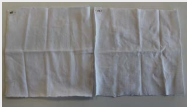
Antes da aplicação: