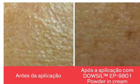
Figura 3: Efeito mate após seis horas

O uso de um creme contendo 10% do DOWSIL™ EP-9801 Hydro Cosmetic Powder e protetor solar orgânico apresenta uma redução visual significativa no brilho da pele, até seis horas após a aplicação (Figura 3). (Utilizou-se 0,02 g/cm 2 de creme na testa.)