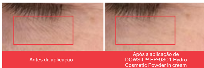
Figura 4: Efeito imediato de mascaramento de rugas

O pó também tem propriedades Soft Focus que se traduzem na capacidade de ajudar a disfarçar imperfeições da pele (Figura 4).