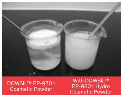
Figura 1: Propriedades de dispersão em água do DOWSIL™ EP-9801 Hydro Cosmetic Powder

Glicerina pode ser usada para ajustar a densidade da água. Também pode ser adicionada posteriormente a uma formulação existente.