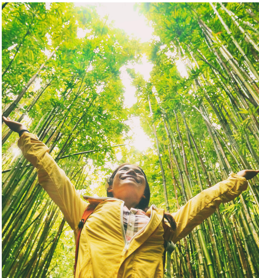
5 供应商之商业行为守则